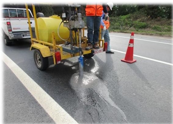
Extracción de testigos de pavimentos, sector Colcura